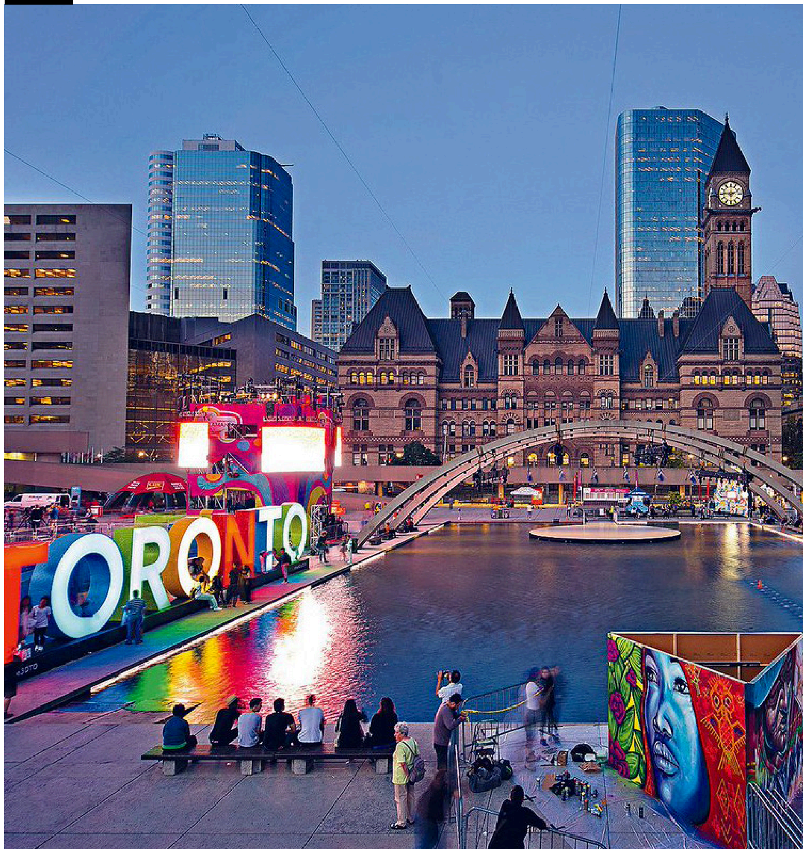
*Imagens meramente ilustrativas.