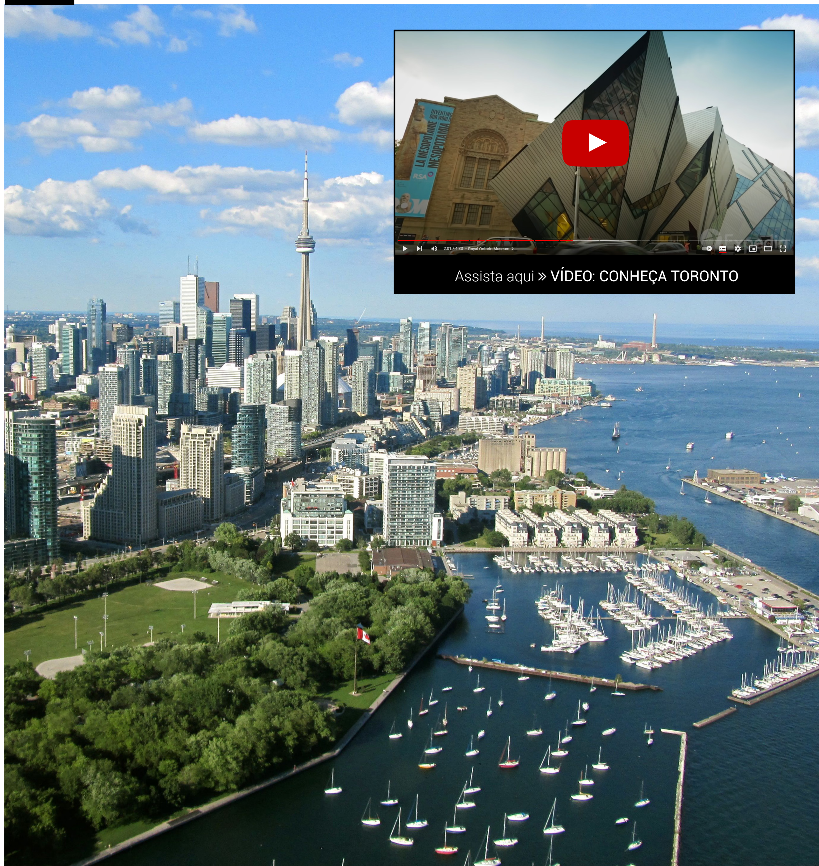
*Imagens meramente ilustrativas.