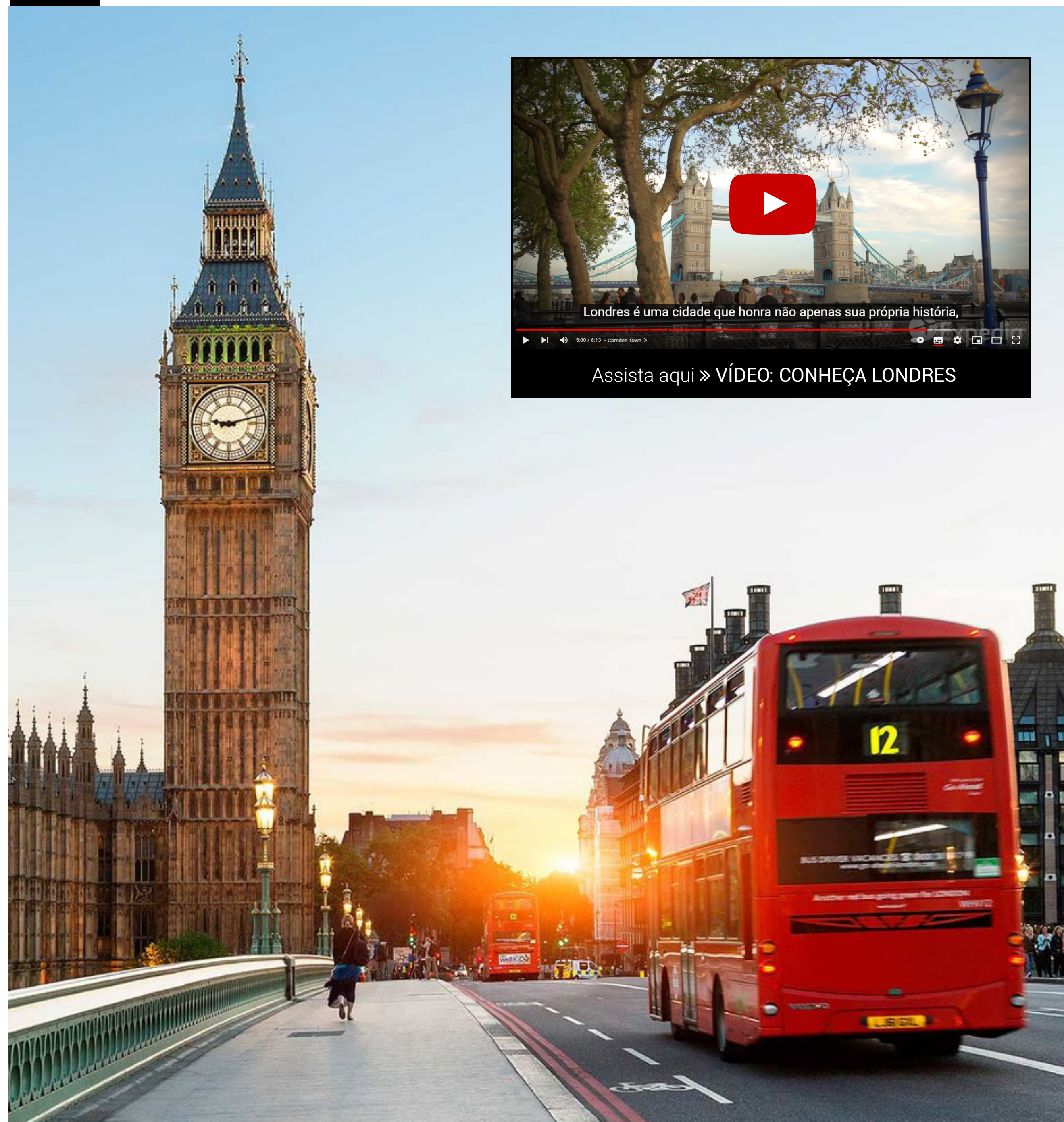
*Imagens meramente ilustrativas.